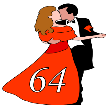
2010 (аг. Одельск)