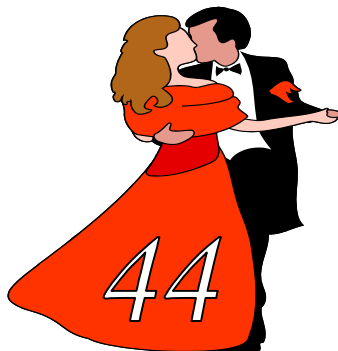
2014 (аг. Индура)