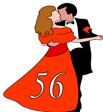
2012 (аг. Свислочь)