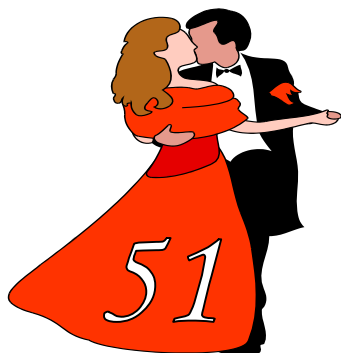
2016 (аг. Путришки)