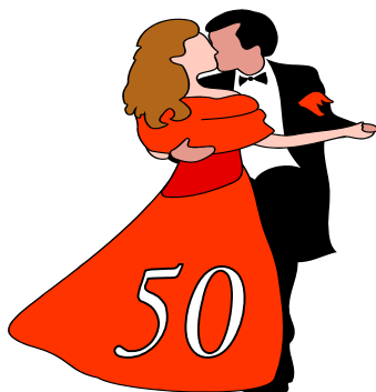
2017 (г. Скудель)