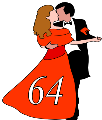
2007 (г. Скудель)