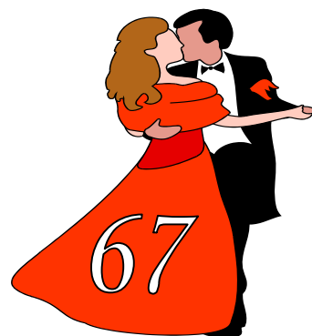
2009 (аг. Обухово)