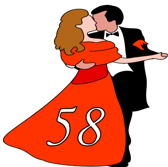
2013 (г.п. Сопоткин)