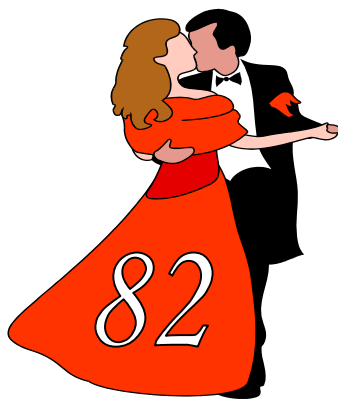
2008 (аг. Обухово)