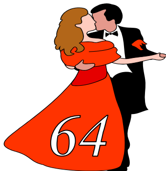
2011 (аг. Поречье)